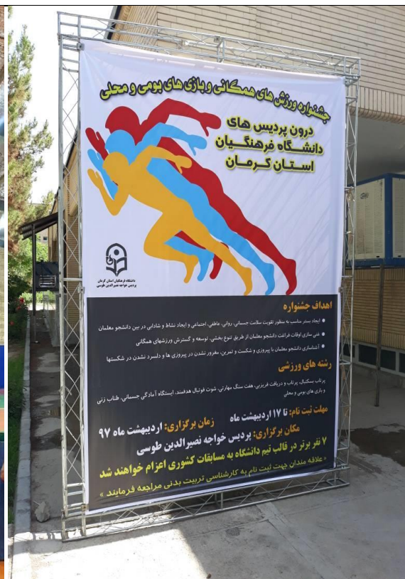
تصویر شماره ۵