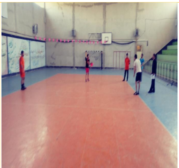
تصویر شماره ۷