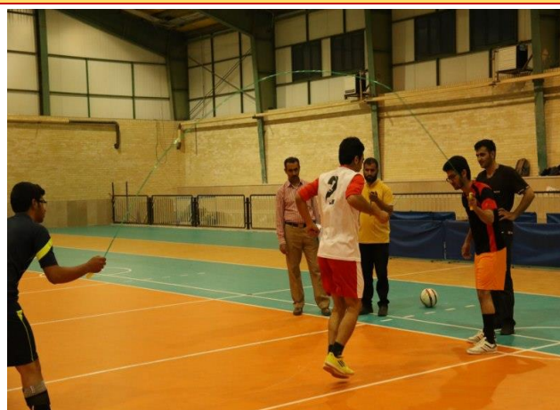
تصویر شماره ۳