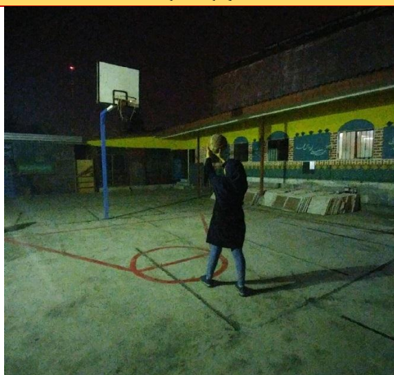
تصویر شماره ۴