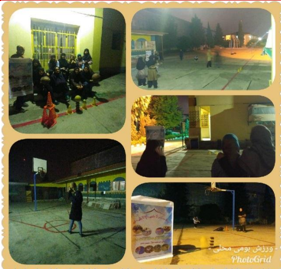
تصویر شماره ۲