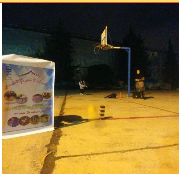
تصویر شماره ۳