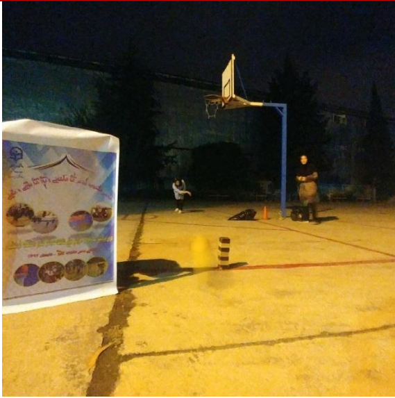
تصویر شماره ۶