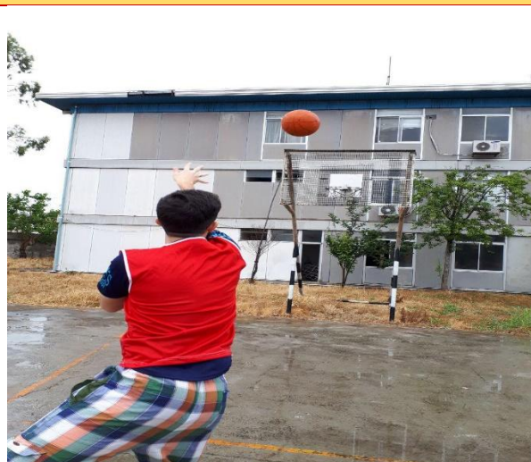
تصویر شماره ۴