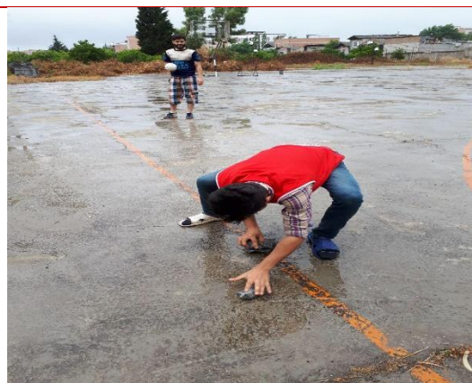
تصویر شماره ۱