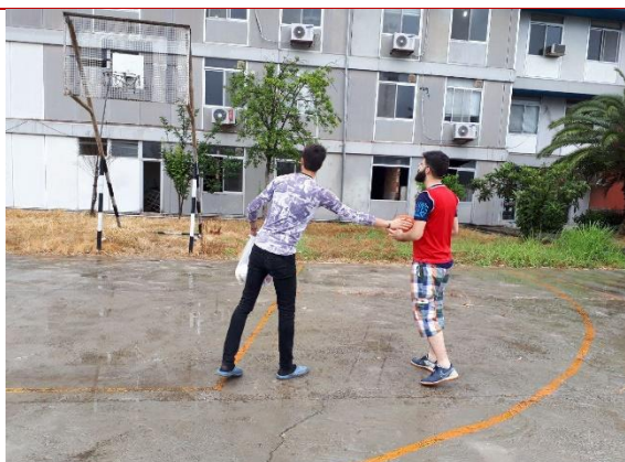
تصویر شماره ۲