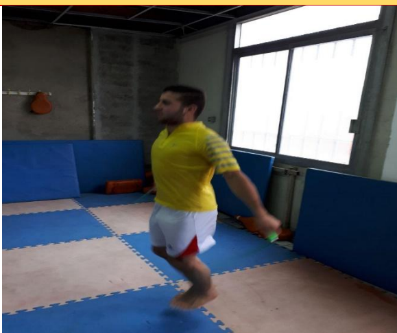
تصویر شماره ۶