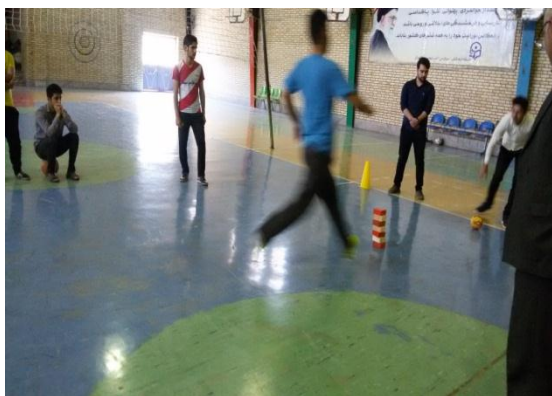
تصویر شماره ۸