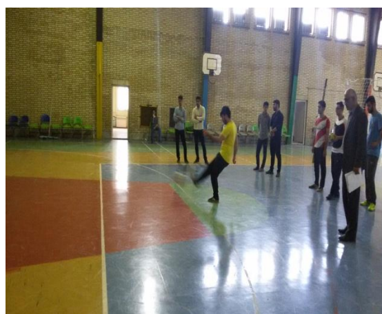
تصویر شماره ۱۱