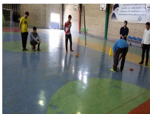
تصویر شماره ۹