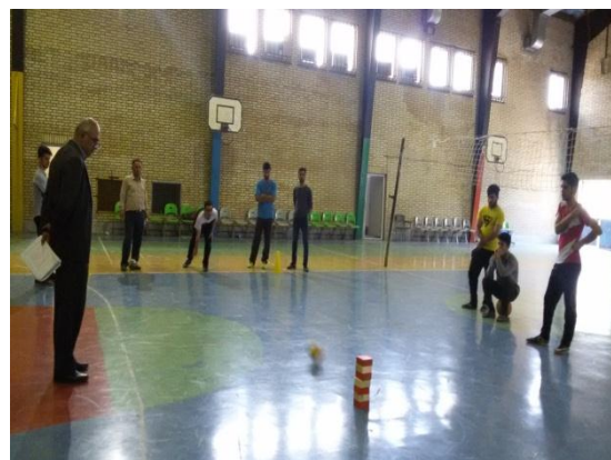
تصویر شماره ۷