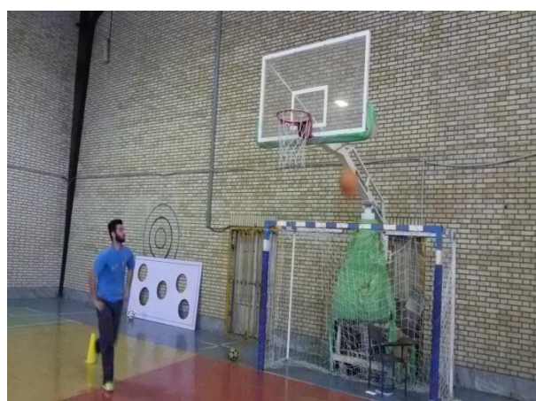
تصویر شماره ۱۲