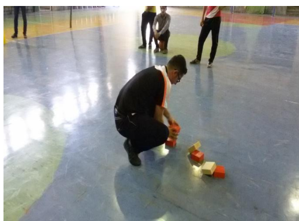
تصویر شماره ۱۰