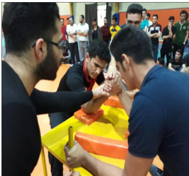
تصویر شماره ۶