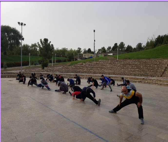
تصویر شماره ۴