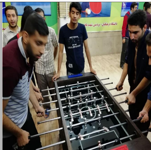
تصویر شماره ۵