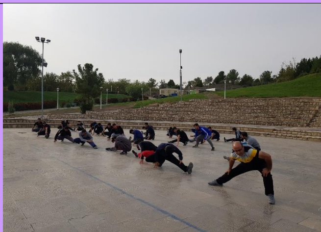
تصویر شماره ۷