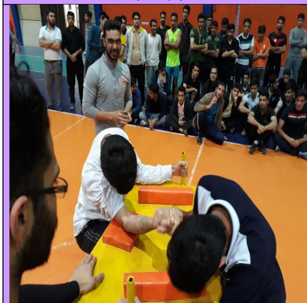
تصویر شماره ۸