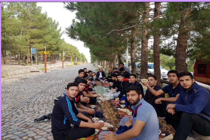
تصویر شماره ۸