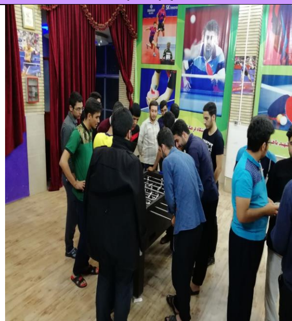
تصویر شماره ۳