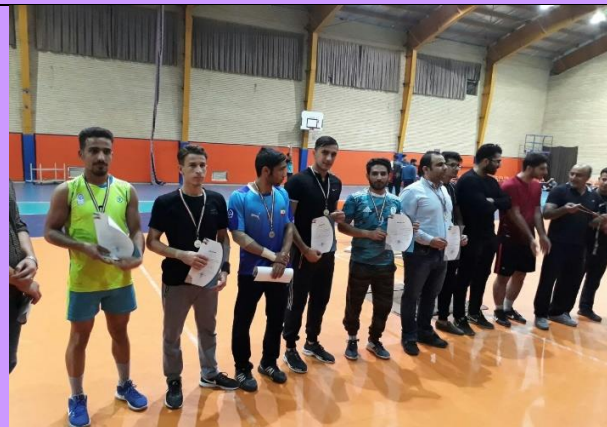
تصویر شماره ۱۰