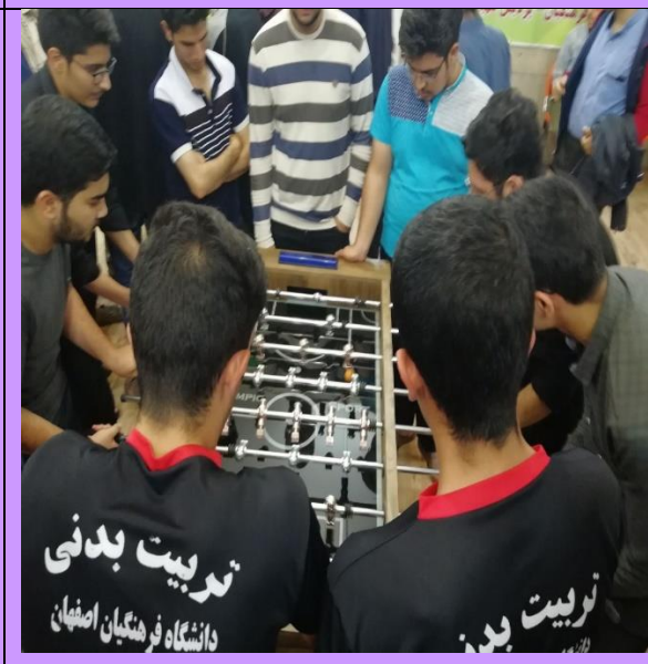
تصویر شماره ۷