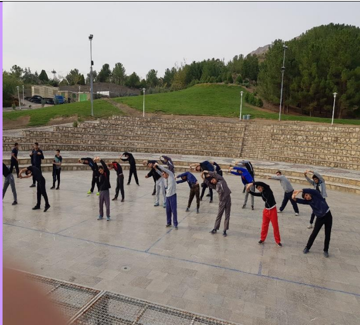
تصویر شماره ۶