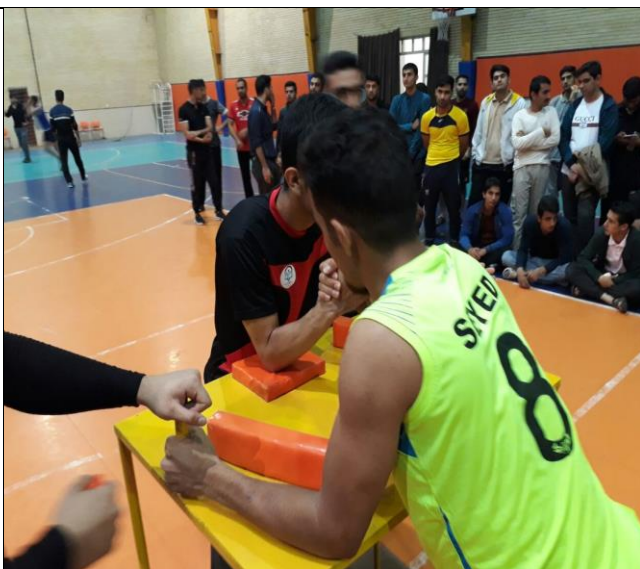
تصویر شماره ۵