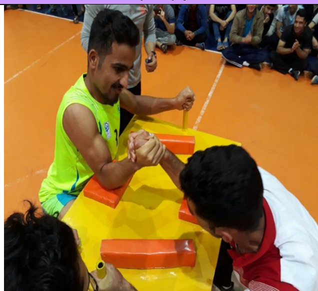
تصویر شماره ۳