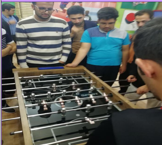
تصویر شماره ۸