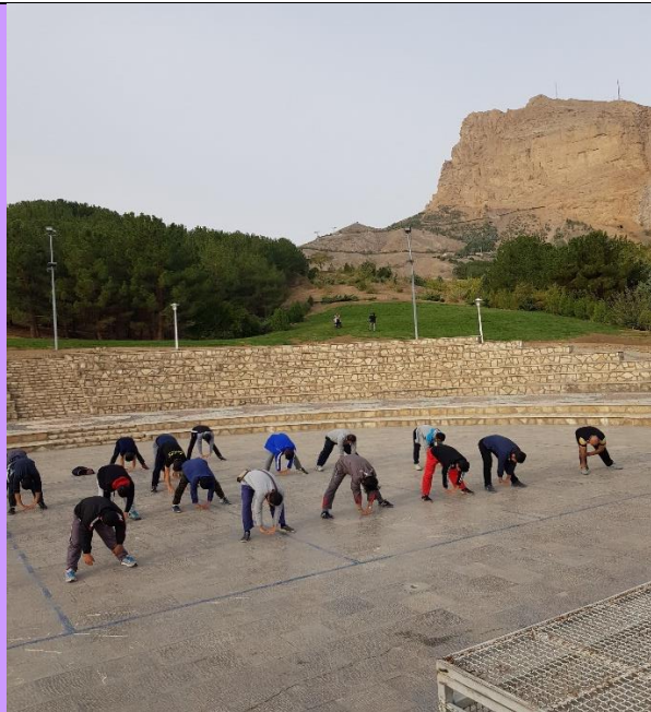
تصویر شماره ۵