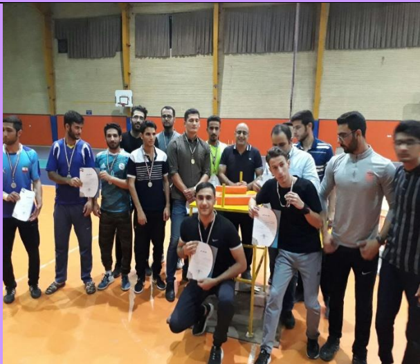
تصویر شماره ۱۲