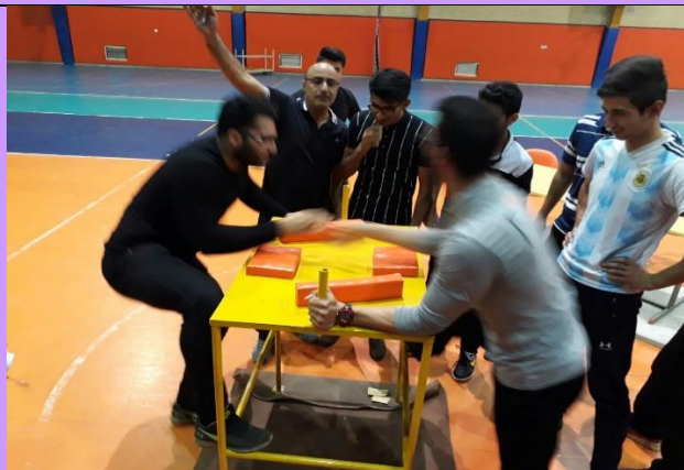
تصویر شماره ۹