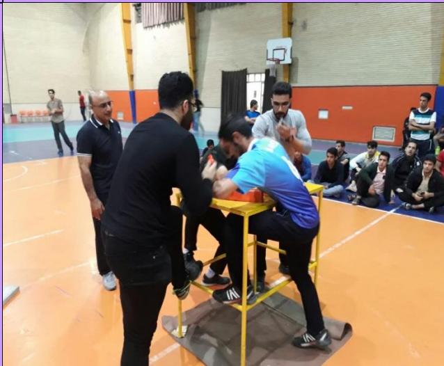
تصویر شماره ۱۱