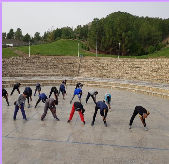
تصویر شماره ۳