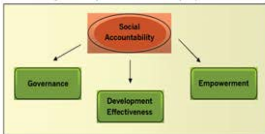
Figure 1 : Why is Social Accountability Important ?