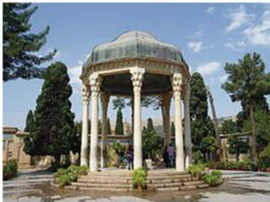
«خل پذیر بود هر بنا که می بینی مگر بنای محبت که خالی از خل است».

در شعر حافظ و دیگر شاعران پارسی شاهد نوعی ستایش گناه هستیم. این ستایش در واقع مدح رحمت خداوندی است. توجیه آن ساده است، اما نه مطابق میل واعظ متعصبی که به دوزخیان زمین، به منزله پاداش پرهیزکاری شان در دنیا، وعده دنیای بهتری می دهد. حضرت آدم اول گناهکار بود که به یکی گندم «بهشت ابد از دست بهشت»، و به زمین تبعید شد. از این رو گناه ازلی مرده ریگ حضرت آدم است. خداوند رحمان است و چنانچه انسان به گناهی دست نیازد خداوند چگونه می تواند رحمان باشد؟ پاسخ طعنه آمیز حافظ به واعظ متعصب بس شنیدنی است: