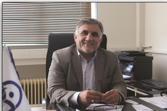
به نام خداوند جان آفرین

نکته دیگر اینکه، نقش نظارتی شورای صنفی-رفاهی موکد در آئین نامه شورا، به عنوان بازوی قوی در سیستم دانشگاهی دارای توانایی بیان مشکلات، نارسائی های صنفی-رفاهی به مسئولین و با هدف با نشاط کردن فضای دانشگاه و دستیابی به مدیریت مشارکتی به