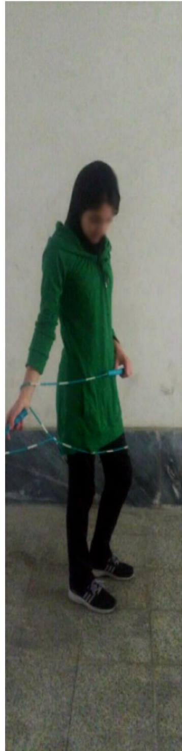
الف - مانتو و شلوار ورزشی