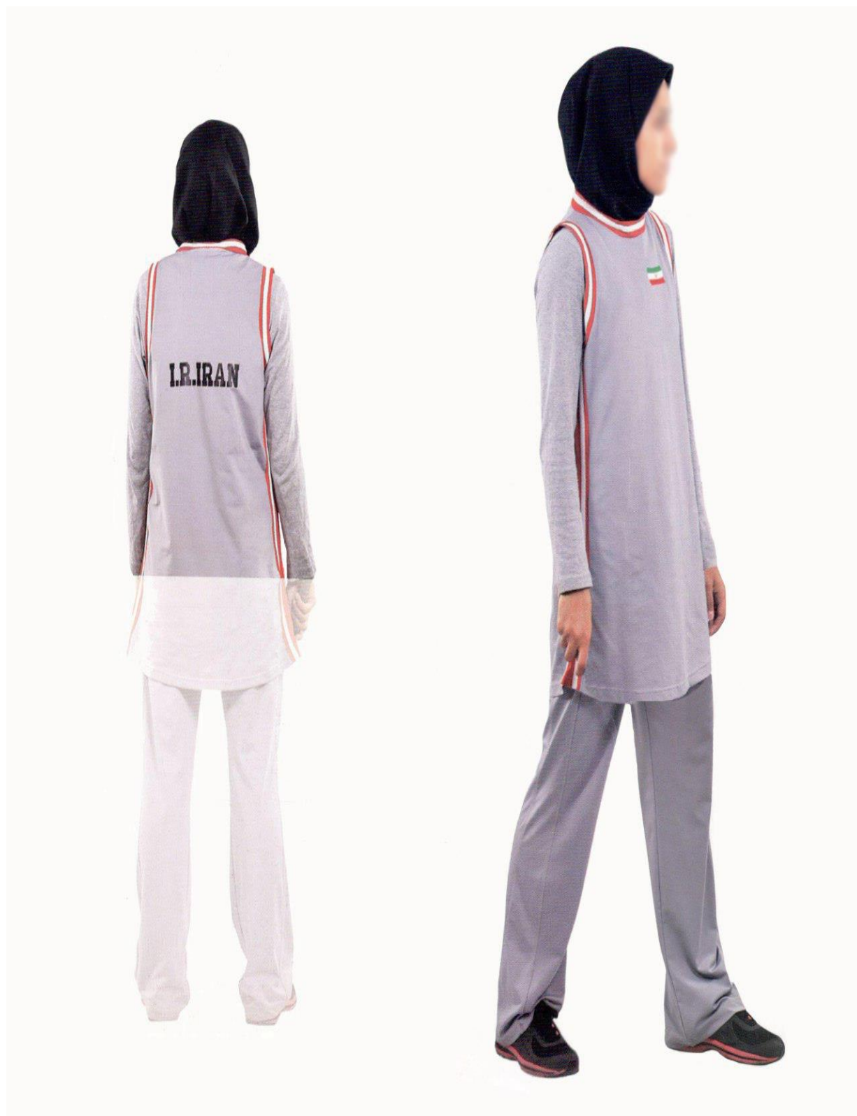
ب - سارافون و شلوار ورزشی